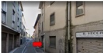
Ingresso alla corte della stabile in cui è situ l'immobile oggetto